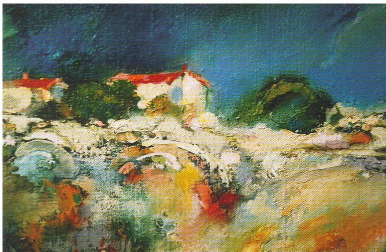
◀ Stara kuća - ulje/platno